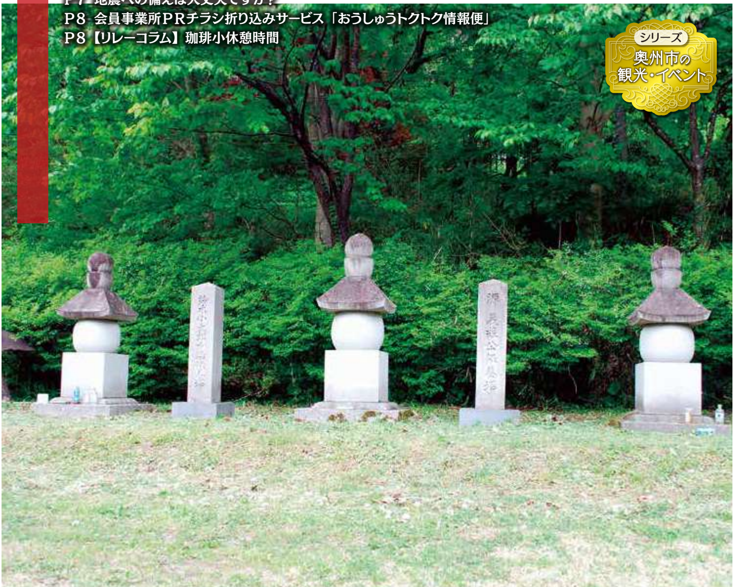
源義経公供養塔（江刺）／源義経公供養塔は義経の家臣だった鈴木三郎重家の子供の重染が建てたと云われる「鈴木山重染寺」の跡地にあります。真ん中に義経の五輪塔、その両側に鈴木家親子の供養塔があります。

この会報は『電子版』でもご覧いただけます。(ホームページ http://www.oshuucci.com/ )