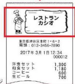
レシートイメージ

お見積 / ご注文 / 補助金についてのサポートはカシオレジスター代理申請協力店の当社まで