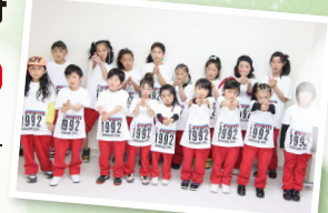
ダンススタジオ コントローラー (一関市・平泉町) 平泉一関の子供たちによる元気なダンスパフォーマンス

22日 11:45~ もちつき隊の もちつき実演 数量限定で無料お振る舞いします。 無料