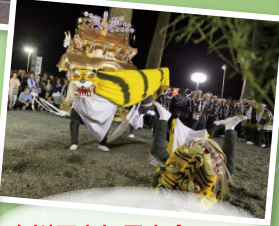
向川原虎舞風虎会 (大槌町) 豊漁と安全を祈願して舞う、沿岸地区の伝統芸能