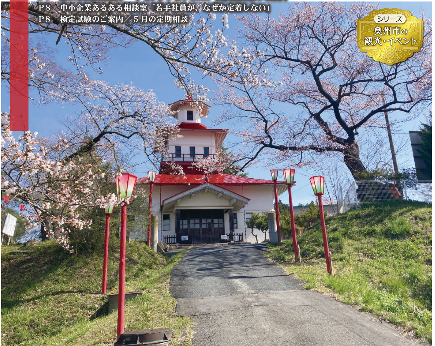
旧岩谷堂共立病院(明治記念館)

この会報は『電子版』でもご覧いただけます。(ホームページ http://www.oshucci.com/ )