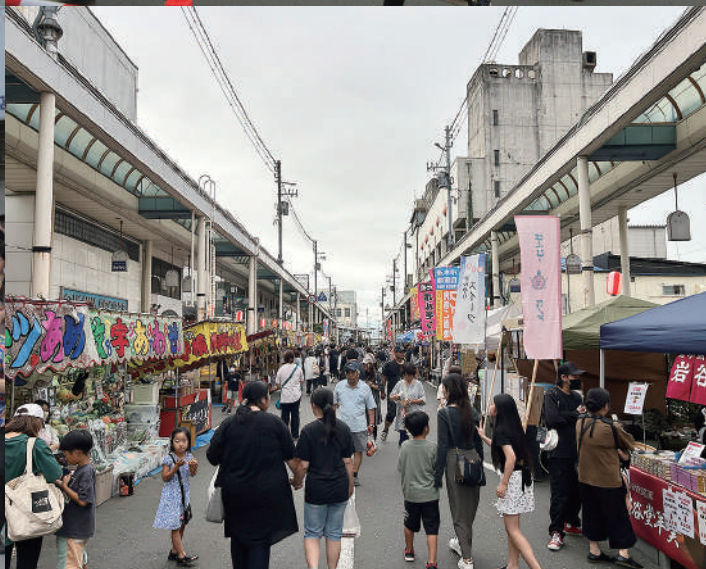
第3回奥州秋まつり

この会報は『電子版』でもご覧いただけます。(ホームページ http://www.oshucci.com/ )