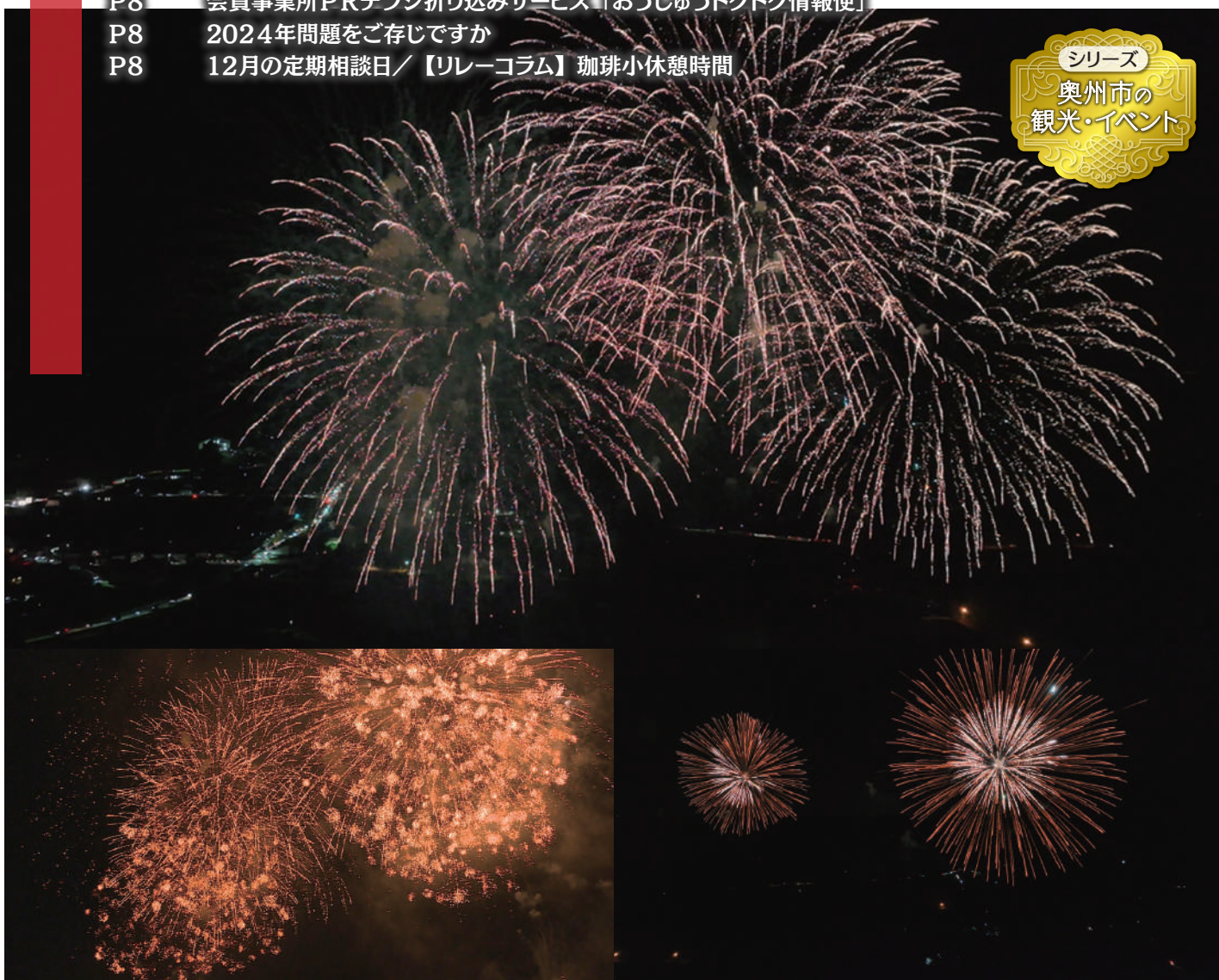
第2回奥州の花火大会

この会報は『電子版』でもご覧いただけます。(ホームページ http://www.oshucci.com/ )