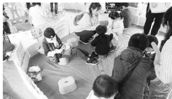
29日「奥州いさわONEさ～くるフェスタ」の様子