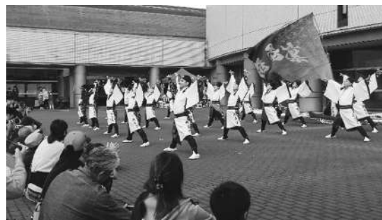
28日「いさわ商工秋まつり」の様子