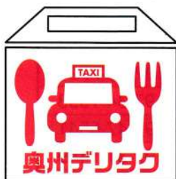
【注文→配達までの流れ】